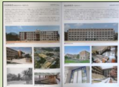
高座旧校舎と新校舎