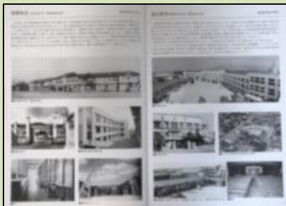
染殿校舎と建石校舎