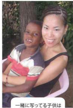
一緒に写ってる子供は息子ではありません!