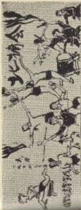
練習場内風景ニシテキキ