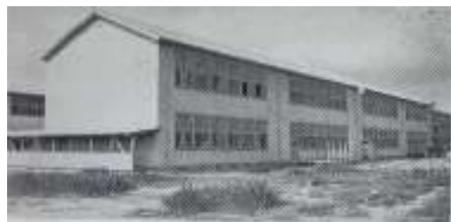
第一教育館 昭和五年完成