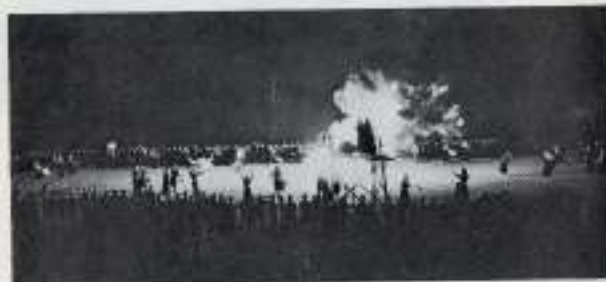
12月1日 ストール 火災より後に撮影