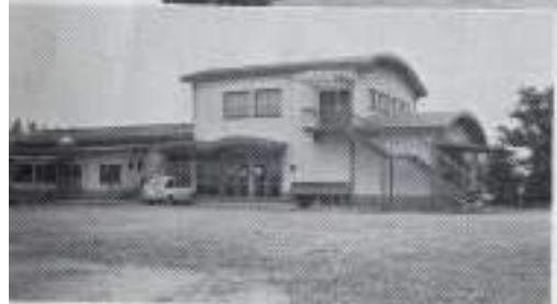
青柳館 第二分館 昭和五年完成