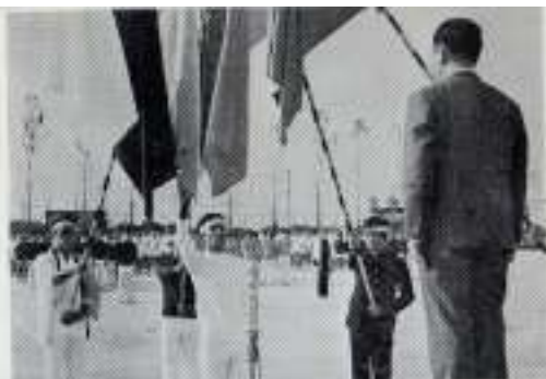
三旗を翻る二重奏