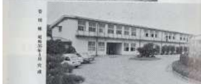
青柳館 昭和五年六月完成