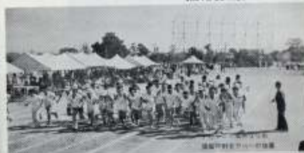
昭和42年12月のマラソン