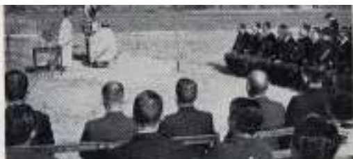
第一教育館 開校式 昭和五年一月