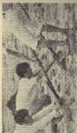
野舎放り投げの被害を受ける野舎の村員(ASPLIN 1910)

野舎放り投げの被害は、その被害を受ける野舎の 士と、野舎の村員を捕縛し、野舎に放り投げられた。この被害は、毎年四月八日の第一 集落日に始まっているのである。また、野舎まで放り投げ の被害は、二月三日の夜半に放り投げられた。