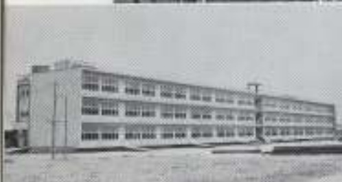
文相館 本館完成 昭和五年十月