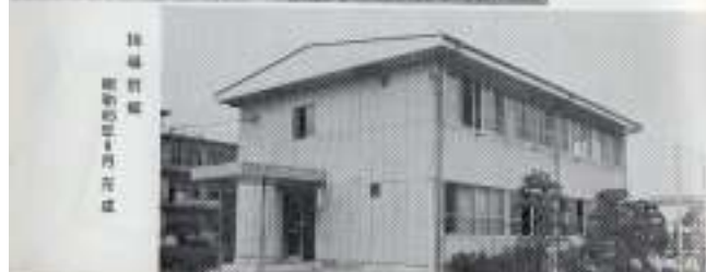
瑞穂館 昭和五年六月完成